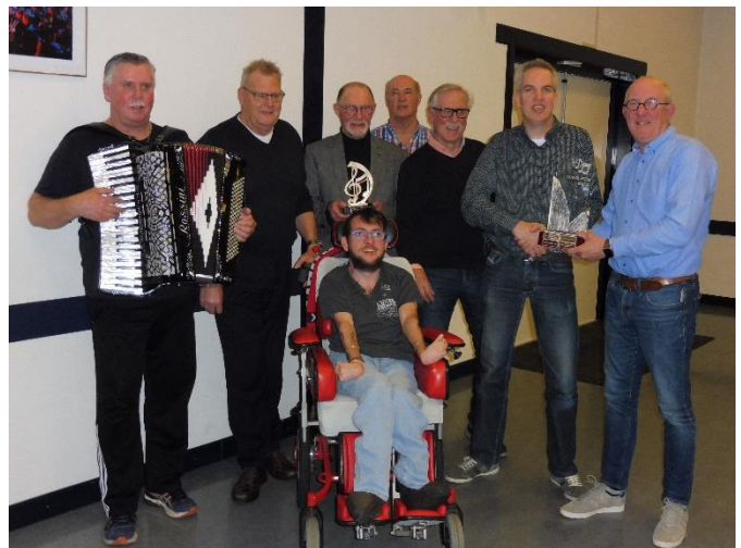
1 De winnaars van de Daan de Ridder Bokaal 2019

We vinden het wel heel fijn om een zwaameester te hebben die ons leiding geeft bij het ritme en de noten. Maar ook onze dirigent kan het niet alleen.